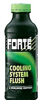
COOLING SYSTEM FLUSH Tuotenumero 05019

Lisää bensiinimootorin tankkiin: • parantaa ja tasaa puristuksia • poistaa palokarstian paloilasta • puhdistaa imu- ja pakoventtiileitä sekä lämmittimet • palauttaa happianturin toiminnan • vähentää haitallisia pakokaasupäästöjä • vähentää EGR-venttiilistä johtuvaa moottorin likaantumista • erityisesti talvisäilytykseen - neutraloi tankin happamuuden