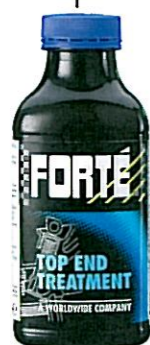
TOP END TREATMENT Tuotenumero 40517

Lisää käytettyyn öljyyn ennen öljynvaihtoa: • puhdistaa koko voitelujärjestelmän • vähentää öljynkulumista • tasaa puristuksia • pitää hydrauliset venttiilinnostimet hiljaisina • uuden öljyn lisäaineistus toimii suunnitellusti puhdistetussa moottorissa • neutraloi öljytulan • palauttaa tehoa