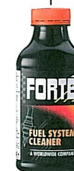
FUEL SYSTEM CLEANER Tuotenumero 42017

Lisää dieselmootorin tankkiin tai polttonestesuodattimeen: • estää bakteerikasvustoa, lietteen muodostusta ja suodattimen tukkeutumista • puhdistaa polttonestepumpun, -suuttimet ja lisälämmittimet • tasaa puristuksia ja parantaa käynnistyvyyttä • vähentää savutusta • voitelee korkeapainejärjestelmät kuten yhteispaine (Common Rail) ja pumppusuutinjärjestelmät