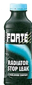
RADIATOR STOP LEAK Tuotenumero 05219

Lisää puhdistettuun jäähdytysjärjestelmään: • estää ylikuumentamista • estää syöpymistä, ruostumista ja kavitaatiota • paikallistaa ulkoiset vuodot fluoresoivan väriaineensa avulla • voitelee vesipumpun