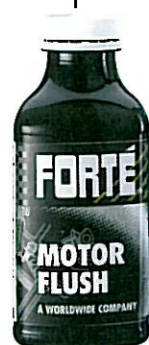
MOTOR FLUSH Tuotenumero 40117

Lisää käytettyyn öljyyn ennen öljynvaihtoa: • puhdistaa koko voitelujärjestelmän • vähentää öljynkulumista • tasaa puristuksia • pitää hydrauliset venttiilinnostimet hiljaisina • uuden öljyn lisäaineistus toimii suunnitellusti puhdistetussa moottorissa • neutraloi öljytulan • palauttaa tehoa