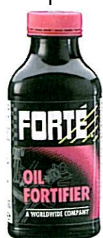
OIL FORTIFIER Tuotenumero 40317

Lisää uuden öljyn joukkoon: • estää lakan muodostusta sylinterin seinämällä ja venttiilivarsien pinoilla • vähentää ja estää öljyietteen muodostumista • pienentää polttoneite- ja öljyperäisten kerrostumien muodostumista moottorin • vähentää lakkajäänteitä männänrenkaan urissa.