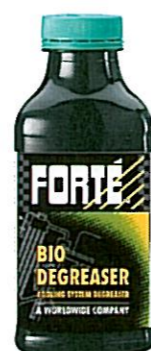
BIO DEGREASER Tuotenumero 05517

Lisää puhtaaseen jäähdytysjärjestelmään: • estää jäähdytysnestevuodot huokoisista ja hiushalkeamista • soveltuu hätäkorjauksiin • vähentää ajan hukkaa ja kalliita korjauksia pitkällä veneyli- ja lomamatkoilla