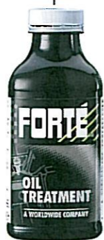
OIL TREATMENT Tuotenumero 40217

Lisää uuden öljyn joukkoon: • estää lakan muodostusta öljynkulutusta • vähentää moottorin savutusta ja siten öljyrantuja vedessä • parantaa puristuksia • lisää öljypainetta • vähentää kulumista • palauttaa vanhan, väljän moottorin tehoa