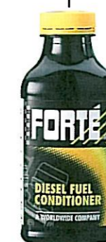
DIESEL FUEL CONDITIONER Tuotenumero 44417

Lisää dieselmootorin tankkiin tai polttonestesuodattimeen: • estää bakteerikasvustoa, lietteen muodostusta ja suodattimen tukkeutumista • puhdistaa polttonestepumpun, -suuttimet ja lisälämmittimet • tasaa puristuksia ja parantaa käynnistyvyyttä • vähentää savutusta • voitelee korkeapainejärjestelmät kuten yhteispaine (Common Rail) ja pumppusuutinjärjestelmät