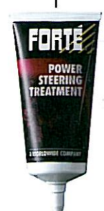
POWER STEERING TREATMENT Tuotenumero 01301

Käytä puhdistamiseen: • puhdistaa joutokäynnin säätöjärjestelmät • puhdistaa kaasuläppäkotelon ja kaasutiimen • herkistää takertelevan kaasuläppän mekanismit • parantaa joutokäyntiä ja ajettavuutta • puhdistaa irrotetut moottorin osat