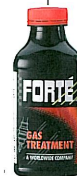
GAS TREATMENT Tuotenumero 42117

Lisää bensiinimootorin tankkiin tarvittaessa kauden aikana: • puhdistaa koko polttonestejärjestelmän ja -suuttimet • korjaa nykyisiä ja sammuilua aiheuttavia ongelmia • neutraloi tankin happaman ympäristön • palauttaa tehoa • hoitaa tankissa olevan veden turvallisesti