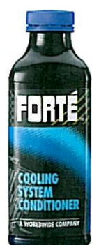
COOLING SYSTEM CONDITIONER Tuotenumero 05119

Huuhtelee jäähdytysjärjestelmää: • estää tukkeutumisen aiheuttamat ylikuumentamisongelmat • liuottaa ja poistaa kalkkeumat sekä ruoste- ja raskasmetallijärjestelmän sisäpinoilla • palauttaa jäähdytysjärjestelmän lämmönsiirtokyvyn