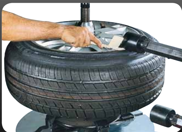
● INSERIMENTO DELLA REGLETTE ● FITTING THE "RÉGLETTE"