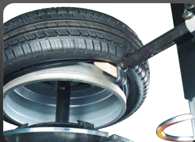
● FASE DI STALLONATURA, SMONTAGGIO RUOTA PAX ● BEAD BREAKING AND DEMOUNTING A PAX WHEEL