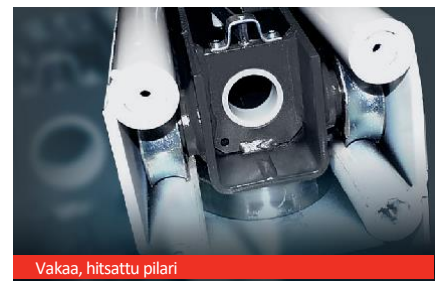
Vakaa, hitsattu pilari